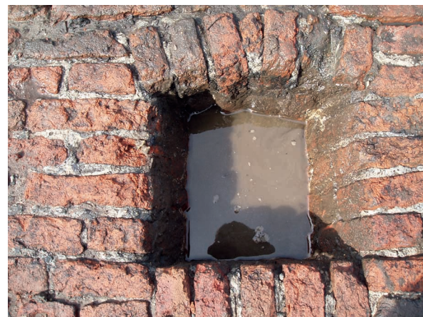
Schietgat van de bovenste rij schietgaten

hebben een onderlinge afstand van 5,5 m. De twee niveaus zijn alternerend aangebracht zodat zich om de 2,75 m. een schietgat bevindt.