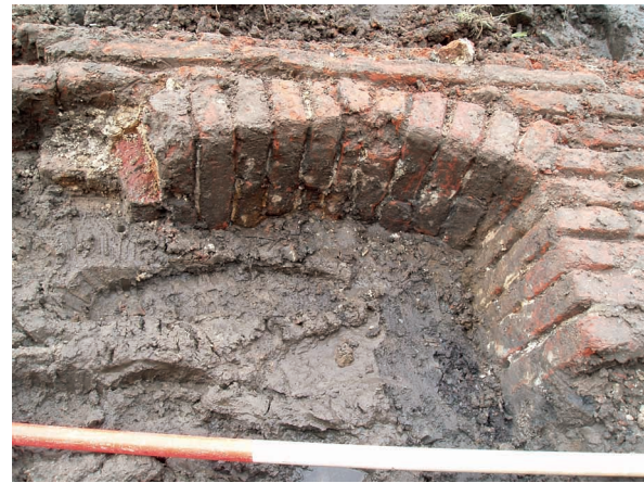
Schietgat van de onderste rij schietgaten

De muur vertoont geen uitkraging zodat duidelijk is dat er geen stenen weergang is geweest. Voor een houten weergang zouden er zich in de muur kortelingsgaten (= steigergaten) moeten bevinden, maar die zijn niet aangetroffen. Dit betekent dat een houten weergang ook niet aanwezig geweest kan zijn. Nergens kon de binnenzijde van de muur vastgesteld worden zodat we geen aanwijzingen hebben voor de aanwezigheid van kantelen. Zowel onder als boven de afzaat bevinden zich schietgaten. De schietgaten op één niveau